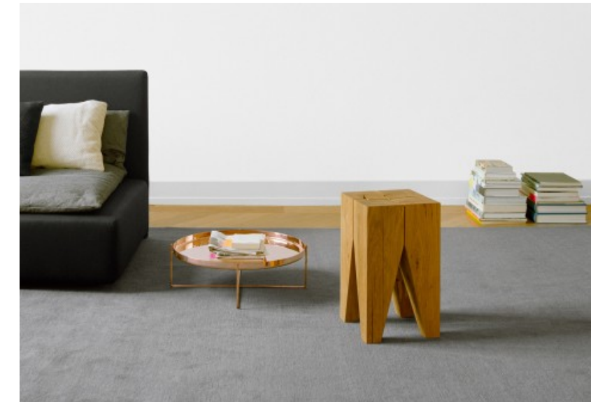
Foto: Copyright © e15 Design und Distributions GmbH | Beistelltisch, BACKENZAHN™