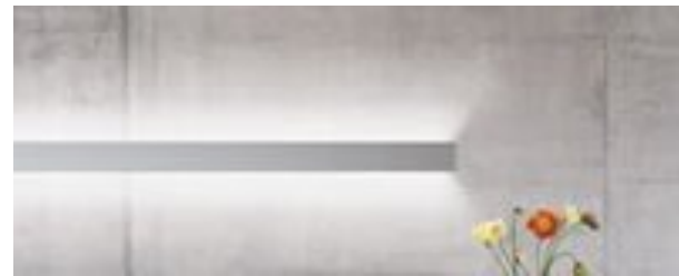
Leuchte, METER BY METER